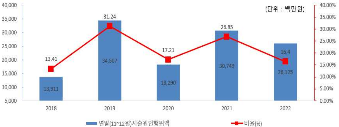
연말지출비율 연도별 변화

☞ 2022년도에는 균형집행 실시 등 계획적인 재정운영으로 연말지출이 전년도에 비해 46억원, 15%감소하였습니다.