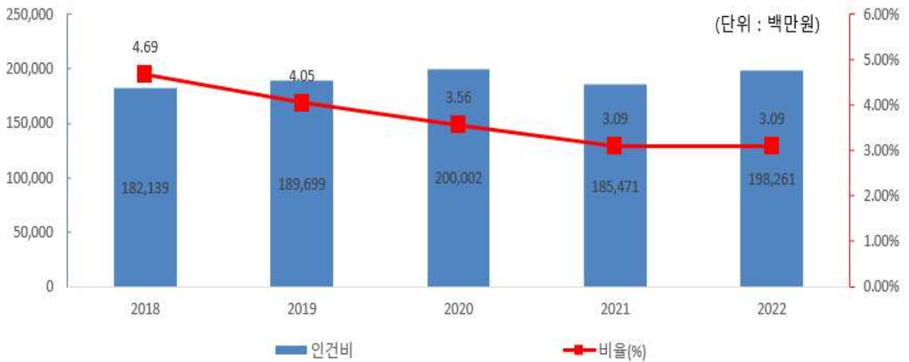
인건비 연도별 변화